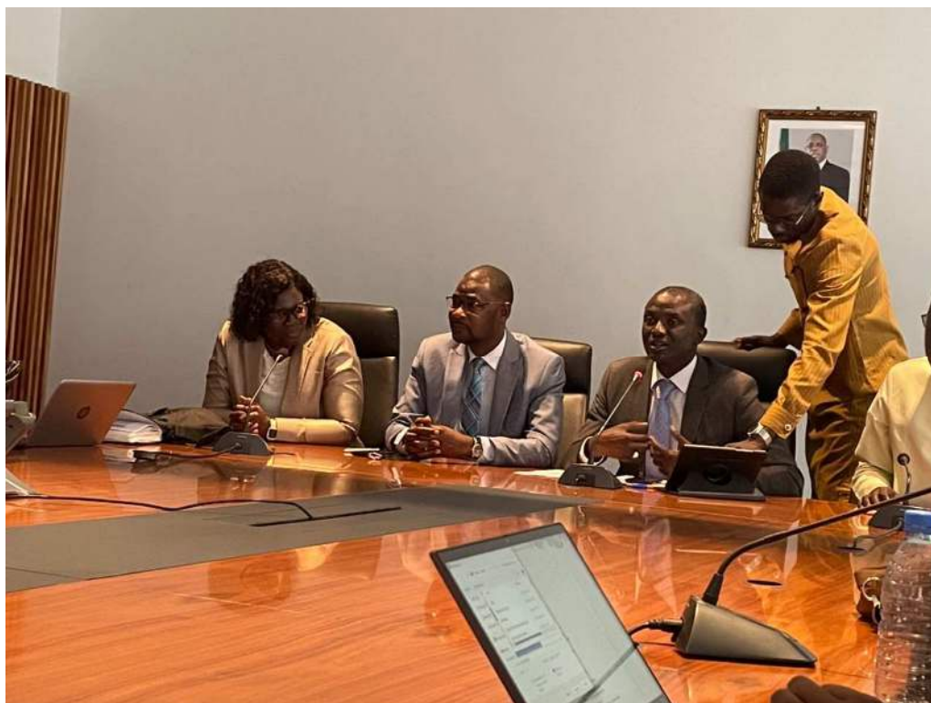
Atelier de validation du ROME verts

Dans l'optique de capitaliser les résultats de la cartographie citée ci-dessus, le BIT s'est joint à l'UNITAR afin de finaliser le travail enclenché pour doter le Sénégal d'un répertoire opérationnel des emplois et métiers (ROME) verts. La Direction de l'emploi a assuré le portage institutionnel de ce travail qui a abouti à l'actualisation et la codification de plus d'une centaine de métiers verts et verdissants.