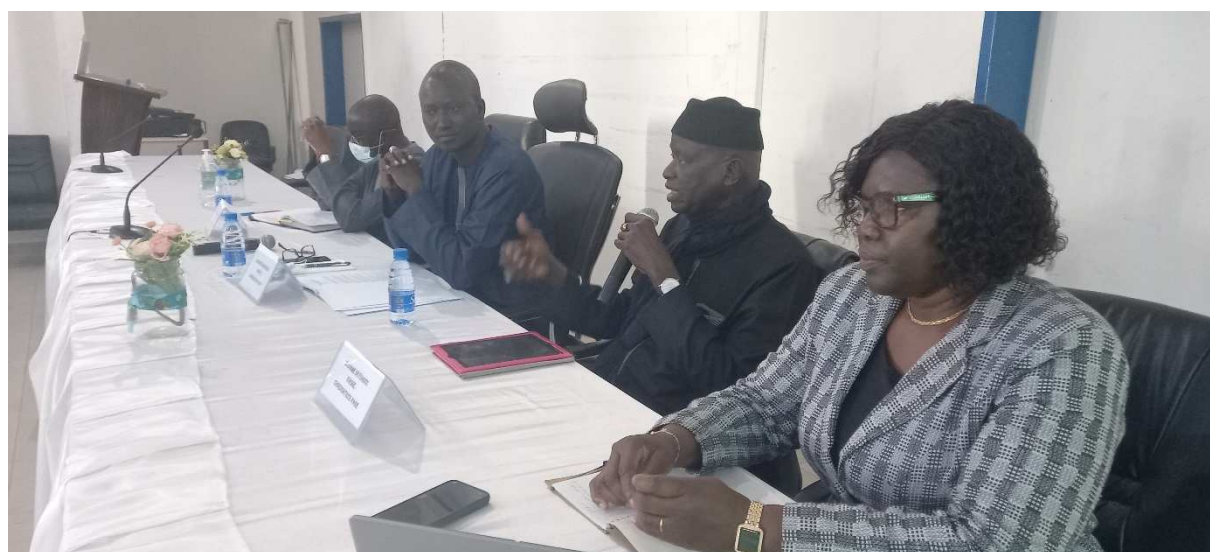
Atelier de validation du document d'orientation stratégique sur la relance verte

Le document d'orientation stratégique, qui a été validé le 29 mars 2022, a permis d'abord de faire un état des lieux dans les secteurs stratégiques de l'Eau et l'Assainissement, la Pêche, les BTP (efficacité énergétique) et l'agriculture, dans une perspective "chaîne de valeurs".