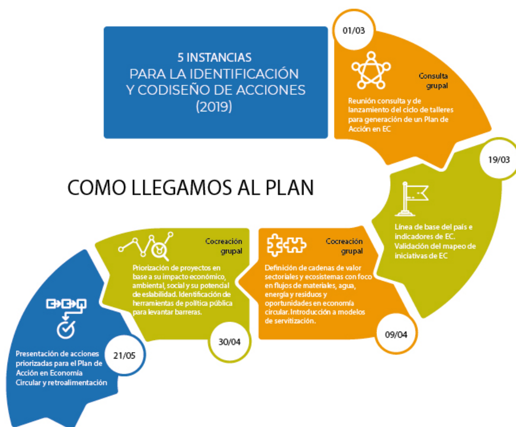
Ilustración 3 Instancias para la identificación y diseño de acciones priorizadas

Participaron 71 inscriptos en el proceso, aportando conocimientos e iniciativa, incluyendo: